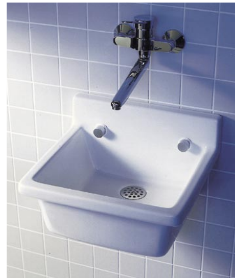
Das Ausgussbecken ergänzt das Duravit-Starck-3-Badprogramm

Philippe Starck ergänzte das Badprogramm Starck 3 von Duravit um ein Ausgussbecken aus Sanitärkeramik. Das 48 cm breite und 42,5 cm tiefe Becken verfügt über eine angeformte, 10 cm über dem Beckenrand ragende Rückwand. Auf Wunsch wird es mit Klapprost geliefert. Die Füllhöhe im Beckeninneren beträgt 16 cm. Dadurch ist das Ausgussbecken für die Reinigung unterschiedlichster Gegenstände und Einsatzbereiche geeignet. Die Keramikoberfläche ist laut Hersteller unempfindlich und reinigungsfreundlich. Als Option ist sie zudem