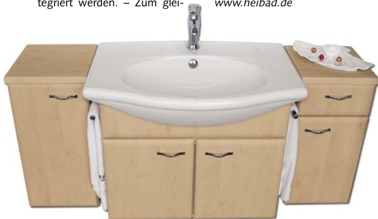
Der V & B-Porzellan-Waschtisch „Velvet“ kann seit Juni 2005 in Heibad Badmöbel integriert werden

Heibad 91180 Heideck Telefon (0 91 77) 4 84 99-0 Telefax (0 91 77) 48 57 67 www.heibad.de